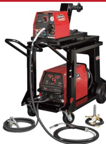
Se muestra: Invertec® V350 PRO Modelo Factory/LF-72 Trabajo Pesado Ready-Pack®